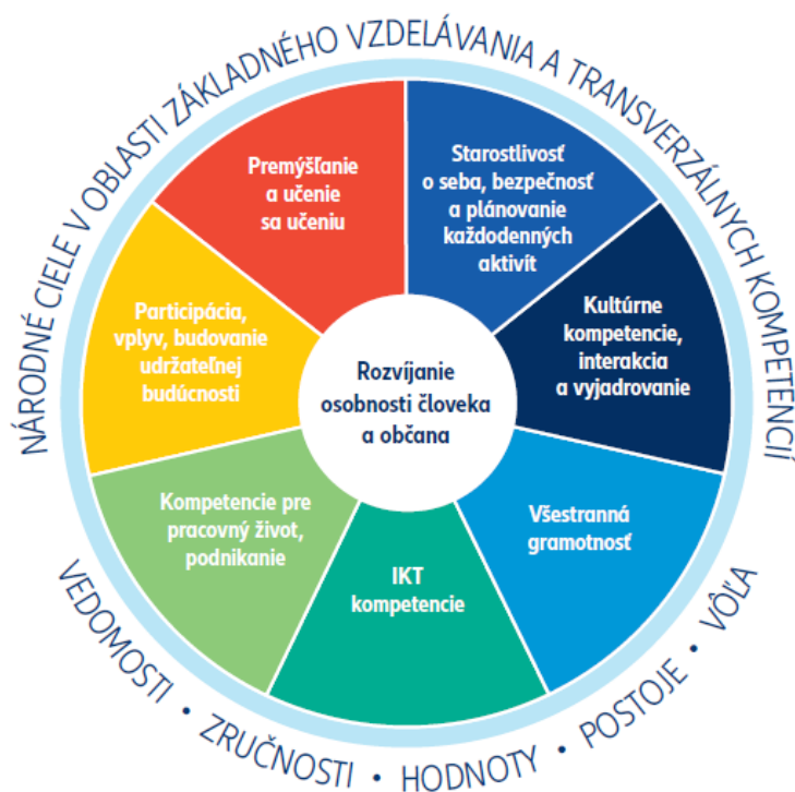
Obrázok 4.2 Transverzálne kompetencie podľa fínskeho národného jadrového kurikula pre základné vzdelávanie